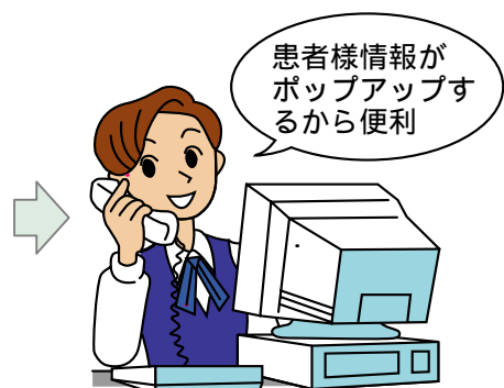
患者様情報を確認しながら通話