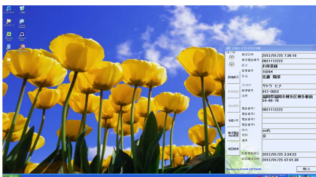
各パソコンに患者様情報をポップアップ