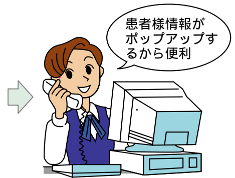
患者様情報を確認しながら通話